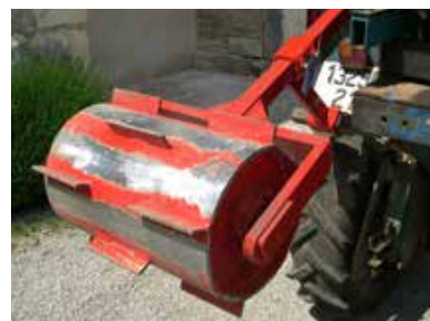
Mulch par rolofaca

Il faut un sol très fertile pour favoriser le développement de la vigne et de l'enherbement.