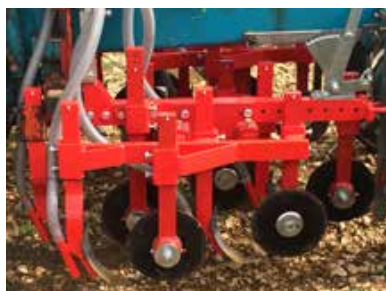
Broyage ou enherbement semé tous les 3 ans sans entretien